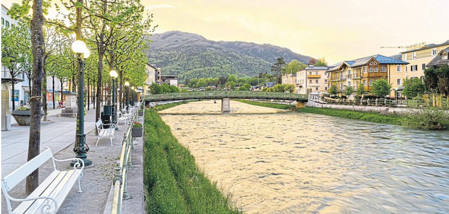
Bad Ischl – die charmante Kleinstadt an der Traun ist das kulturelle Zentrum des Salzkammergutes und eine besondere Schönheit. Your Austrian Home bietet die perfekte Unterkunft für eine wohl verdiente Auszeit.

Wenn auch etwas anders. So schippert man heute mit Kajak oder SUP über den See, erklimmt mit dem E-Bike die umliegenden Berge oder erlebt eine erkenntnisreiche Kräuterwanderung – all das bis spät in den Herbst hinein. Eines ist aber gleichgeblieben: die Sehnsucht, im Urlaub einen Rückzugsort zu haben – quasi ein zweites Zuhause mit maximalem Wohlfühlfaktor. Ob elegantes Apartment, Ferienhaus am See oder gemütliche Ferienwohnung, Your Austrian Home bietet ein gehobenes Potpourri an eindrucksvollen Unterkünften. Jedes Objekt ist ein Unikat und überzeugt mit modern-traditionellem Interieur. Besucher haben die Wahl zwischen der malerischen Aussicht auf den Wolfgangsee, dem lebendigen Treiben in der Kaiserstadt Bad Ischl oder einer Auszeit in den Natur-